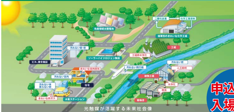
光触媒が活躍する未来社会像