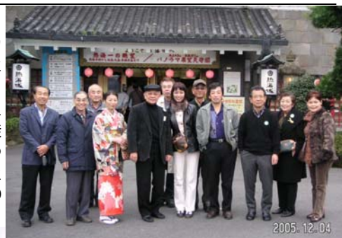
ウエイに乗ったのは皆初めてで、いつもの熱海とは違って

てちょっとぴり新鮮な体験でした。でも「熱海城」までの坂道は、二日酔いにはきつかったかも…。