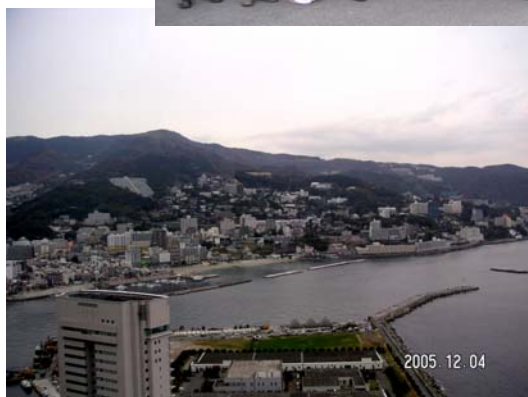
熱海城の前で(上) 山頂から熱海の街を展望(左)

てちょっとぴり新鮮な体験でした。でも「熱海城」までの坂道は、二日酔いにはきつかったかも…。