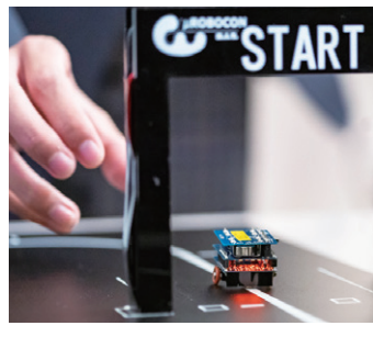
1インチ角のロボットが白線コース上を走る

本大会は1インチ角に収まる小型ロボットを製作し、自律的にコースを走行、タイムを競う競技である。エントリー締め切りは11月末、競技結果提出締め切りは2月3日。ロボットの製作講習会は送迎バスが利用可能な本学オープンキャンパス時にも実施予定。