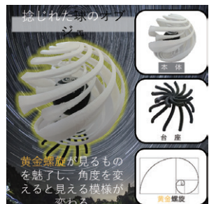
3Dプリンタ造形部門優秀賞(2025年)

今年度も高校生を対象としたデザイン提案のコンテストを開催する。提案書で審査するオリジナルアイデア部門、自由部門の他に、CADデータを審査する3Dモデリング部門、3Dプリンタの出力物で審査する3Dプリンタ造形部門の4部門で作品を募集する。参加登録は8月20日まで。