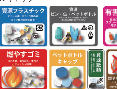
ゴミ箱に貼られている分類シール