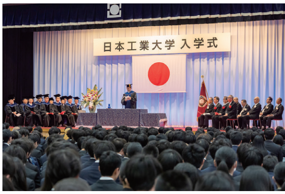
入学式・学長式辞

4月1日、令和8年度入学式を埼玉キャンパスの体育館において挙行した。保護者も多数参列し、会場の収容定員を超過したため、5号館の大教室にライブ中継会場を設置した。 約1100名が新たな一歩を踏み出した。保護者も多数参列し、会場の収容定員を超過したため、5号館の大教室にライブ中継会場を設置した。 中々「面白い、もっと知りたい」という気持ちこそが、学びを楽しい境地へと導く。「知る」を超えて「楽しむ」学びへと到達できるように、本学教職員が全力でサポートする。好奇心のアンテナを広げ、自分だけの学びの旅を始めてほしい」とエールを送った。