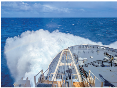
南極域に向かう「しらせ」

南極地域観測隊は我が国が戦後より始めて今回で67回目。現在、急激な気候変動によって地球の淡水9割を占める南極氷床の融解が加速しており、その状況把握と融解メカニズムの解明という世界的課題について連携し調査にあたっている。