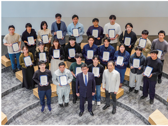
大川陽康奨学金受給者

両奨学金の認定証授与式が4月22日と24日、5号館1階のチューデントプラザにおいて催された。 学業奨励奨学金は学部生111名、大学院生25名を認定した。認定者は、前年度1年間の成績が特に優秀であったエクセレント・スチューデント（ES）に年額50万円、それに準ずるリマーカーナル・スチューデント（RS）に年額20万円が授業料減免の形で交付される。今年度、3学部3学年合計の認定者はESが33名、RSが78名であった。