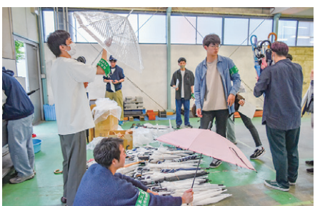
リユース傘を整備する学生たち

特に今年度は、省エネ・創エネの強化に注力し、空調設備の高効率化や、オンサイトPPAによる1.4MWの太陽光発電設備を導入した。これにより、埼玉県地球温暖化対策推進条例が求めるCO2の基準値比50%削減に対し、約54%の削減を実現し、CNに向けた大きな前進となった。