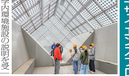
本館の太陽光発電システムの見学

地元宮代町の小中学生が埼玉キャンパスを訪れ、理科や環境について学ぶイベントで、毎年実施している。今年度は2月25日、26日に町内4小学校の6年生約250名が来学。SDGs for Engineersの学生による環境保全に関する講義を受講し、学生環境推進委員会のメンバーから太陽光発電など