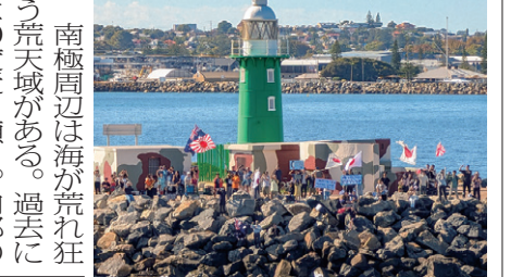
南極周辺は海が荒れ狂う荒天がある。過去には30度近く傾く。内部の機材が心配であったが、フリマントル到着まで2回の荒天域を体験した後、しらせで無事を確認できた。

今年の航海は66次から始まった2レグ制で、しらは豪州と南極域を2往復する。昭和基地での観測実施後、豪州で海洋観測要員と入れ替えてトッテンに向かうことができた。観測隊員の負担軽減と観測能力増強につながる。私は2レグ目のトッテン観測に参加したため、幸運にも学生の成績評価後の乗船となった。ちなみにスタアリンク普及により陸から成績発表を受けられるようになったのは別の話である。