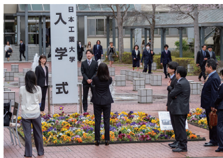
花壇の前で記念写真を撮影する新入生

正面ロビー・東側と14号館前に花壇を整備し、学位記授与式や入学式で多くの学生や保護者が、きれいな草花を背景に写真を撮影する「映えスポット」として親しまれている。EMS、SDGs活動の詳細については、右上のQRコードから大学ウェブサイトをご覧いただきたい。