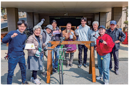
サイクルラックとワークショップに参加したシニア

自転車ツーリズムによる地域活性化を進める福島県郡山町の依頼を受け、本学の学生有志チームが、スタンドのない自転車駐輪するための「サイクルラック」を製作。3月24日に同町の島原橋葉町からの依頼を受け、翌25日にシニア向けの組み立てワークショップを実施した。