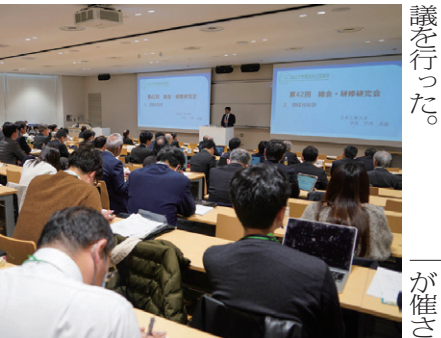
5号館の大教室で研修を受ける参加者

本学一行はスマート農業実験場、工業技術博物館のSL(蒸気機関車)を視察し、本学の特色ある教育・研究環境への理解を深めた。